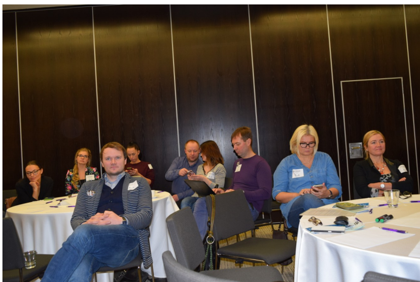
Fotol vasakul: nutikoolitus

Toimus ka esimene koolitus. Fotograaf Kristjan Madalvee õpetas nutitelefone kasutama fotode tegemiseks ning tutvustas erinevaid äppe, mis aitavad telefoni kasutajal meeleolukaid fotosid teha.