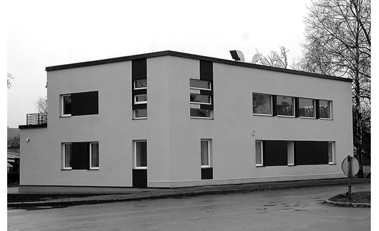
... ja pärast renoveerimist.

IVTL on maakonna ainuke põllumajandusnõuannet pakuv organisatsioon, mis asutati 18. aprillil 1989. aastal. IVTLi on koondunud üle 200 liikme, kes tahavad ja suudavad organisatsiooni arendada. 2005. aas-