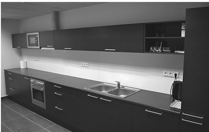
Mööbli disainis ja tarnis Kohtla valla ettevõtte Inest Market.