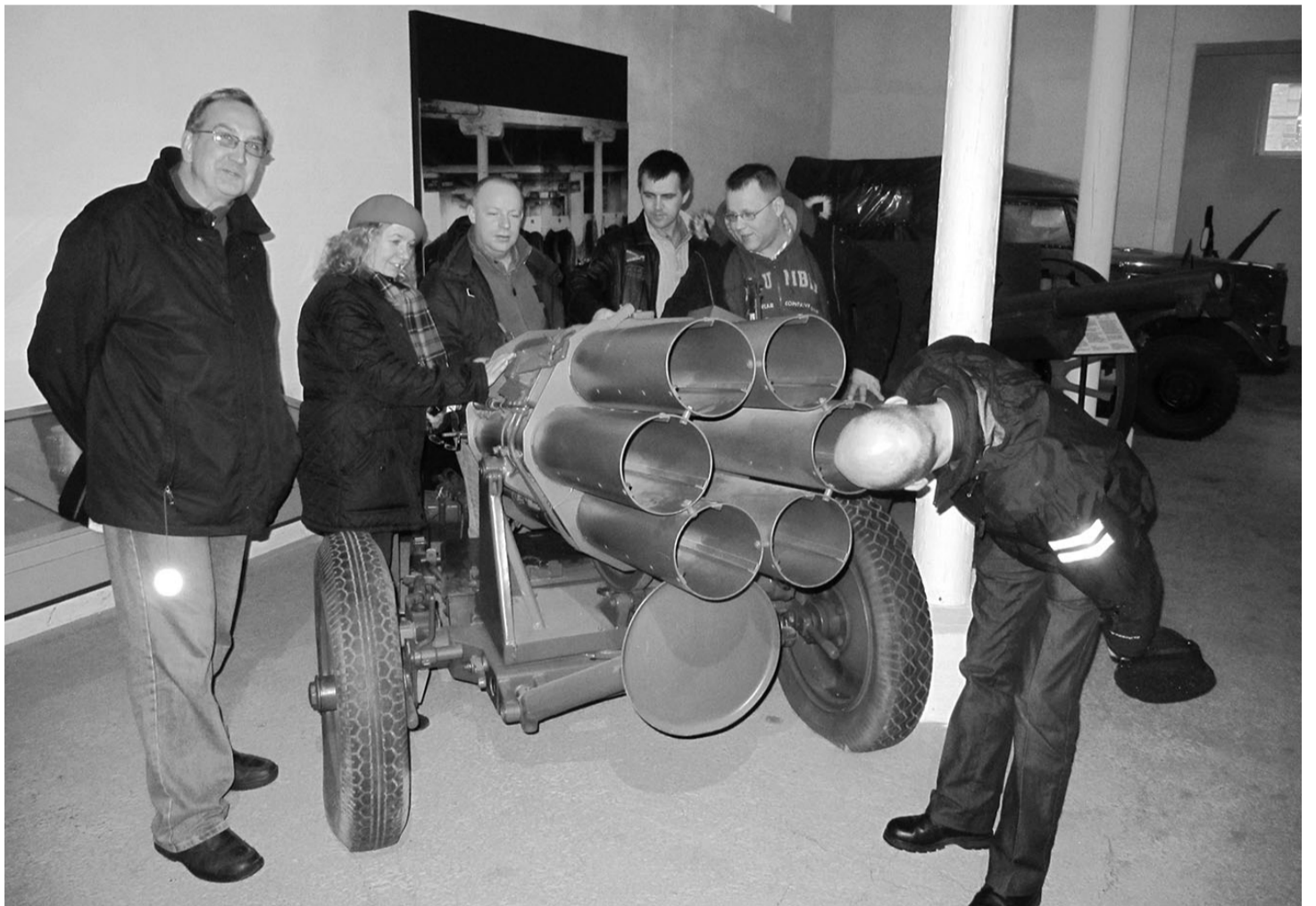
Muuseumisõbrad Hämeenlinna suurtükimuuseumis uurimas mitmelasulist raketihetit ehk "uduheitjat".

2007. aasta lõpust alanud ja 2010. aasta suveni kestnud projektis olidki suuremateks töödeks näituseruumi eraldamine poest, valvesteemide ehitamine ning muuseumieksponaatide loendamine ja kirjeldamine. Muuseumi jaoks koguti ka veteranide mälestusi ja tehti palju tuntuse suurendamiseks: paigaldati teeviidad ja loodi lausa viiekeelne muuseumi kodulehekülj, kus äramärkimist väärib prantsuskeelne variant. Tööd teostas 75% osas Pyhäjärvisseude LEADER-tegevusgrupp, mille esindaja oli meie gruppi tulnud tervitama ning avaldas