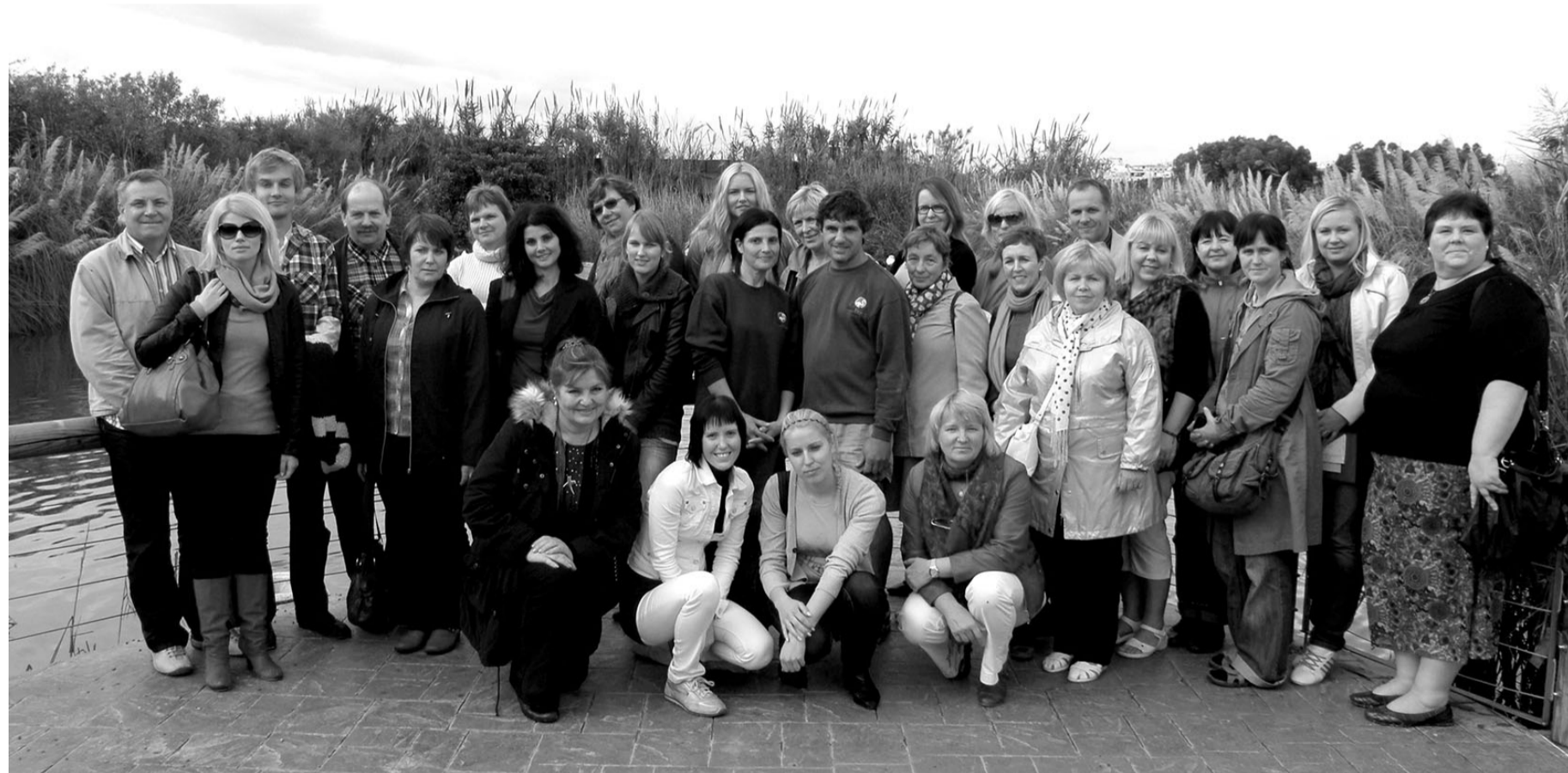
Õppereisil osalesid peamiselt 2011. aasta konkursi "Märka LEADERit" kandidaadid.

Eesti ja Malta on mõlemad väga väikesed riigid (Malta liitus Euroopa Liiduga ka samal ajal kui Eesti - aastal 2004). Kliima on Eestis ja Maltal küll erisugune, ent ilmaga meil ei vedanud, sestap nägime ainult vihmast ja tuulist Vahemere maad. Vaatamata ebasoodsale ilmale, oli meil väga palju ühiseid teemasid, mille osas saime kogemusi jagada: pärimuse ja traditsiooni kasutamine, kohaliku ressursi kasutamine ja kohaliku toidu pakkumine, väikeettevõtluse arendamine ja tulemuslik turustamine. Külastasime kõiki kol-