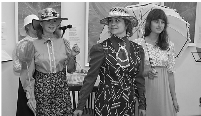
Kostümeeritud etendus õigustas vaatajate ootusi.