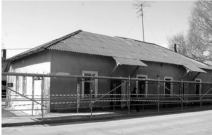
Ida-Virumaa Talupidajate Liidu maja enne...

Valminud maja annab võimaluse läbi viia seminare ja koosolekuid, võtta vastu külalisi ja korraldada kohtumisi.