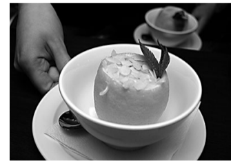
... ja desserdiks täidetud sidrunid.

Kuid kohvik ei toimetanud ainult Jõhvi kontserdimaja sisest, vaid pakub toitlustusteenust ka väljaspool. Mozarti meeskonna ühine huvi on kliendile rahulolu pakkumine, olgu siis tegemist suurema firmaüritusega või sünipäevaga väiksemas seltskonnas. Seetõttu lähenetakse ka igale kliendile individuaalselt, et selgitada välja parim lahendus.