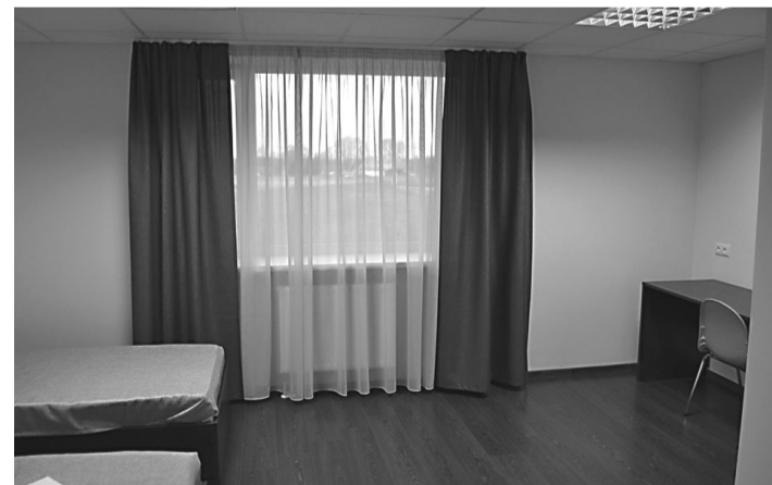
Esimesed külalised ütlesid mugavate tubade kohta kiidusõnu.

Kuigi 35 kohaga majutuskohta nimi on Motovilla, kehtib hostelile omane hinnatase: üks voodikoht maksab 15 eurot, kööginurga, elutoa ja magamistoaga apartement veidi rohkem, samuti on võimalik juurde tellida sauna, saali, köögi jne kasutamist. Korralikke tingimusi võimaldab mõõduka hinna eest pakkuda