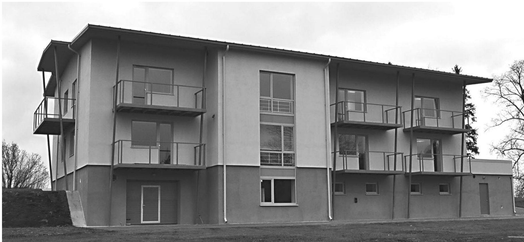
Pühajõel valminud motovilla on valmis külalisi vastu võtma.