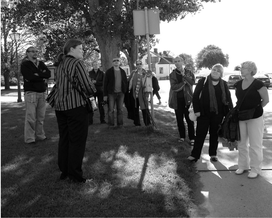
Õppereis Gotlandile oli sisukas ja tiheda programmiga.

ja tiheda programmiga. Peale kahepäevast laevasõitu jõudisime Gotlandi nukuliku pealinna Visbyse. Alustasime jalutuskäiguga vanalinnas, külastasime võrnatu botanika-aeda ja kuulsat Rooside tänavat. Tutvusime ajaloomuuseumis Gotlandi ajaloo ja kohutuse Kvinnfolki käsitööpoe ettevõtlike naistega, kes rääkisid meile oma käsitööst ja ettevõtlusest üldse.