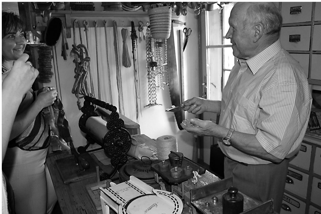
Distelbergeri siidritalus, vanaperemees muuseumi poekeses kommi müümas.