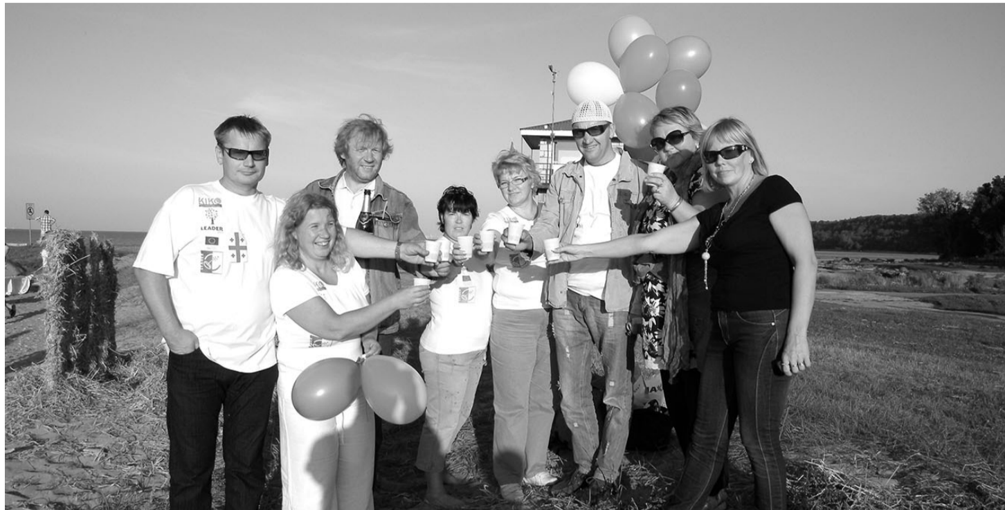
Muinastulede öö Toilas: tuleskulptuuriks valmistasime sünnipäevatoridi, mille märksõnadeks olid 5 aastat tegevust ja koostöö.

2011. aasta taotlusvooru laekus avaldusi 1 102 773 euro ulatuses, toetusteks jagati 543 802 eurot. Kolmas sektor on saanud määratud toetustest 65,5%, ettevõtjad 34,2% ja