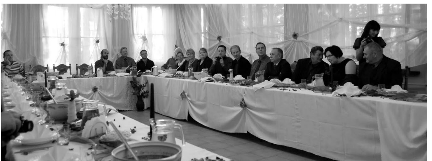
Poola oskab külalisi vastu võtta: Oleckos võeti meid vastu nagu pulmas.

Poolas on LEADER-meetme 2007-2013 avaliku sektori eelarve kokku 787,5 miljonit eurot, millest strateegia rakendamiseks on ette nähtud 79%, koostööprojektidele 1,9% ning kohalike tegevusgruppide administreerimiskuludeks ja muudeks kuludeks 19,3%.