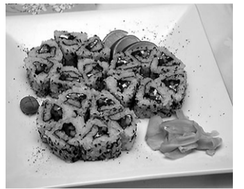
Aasia teemaõhtul pakuti külalistele sushit...