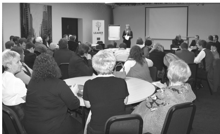
Kõik Ida-Virumaa tegevusgruppid olid läinud perioodi projektide rahastamisega rahul – jagatud oli üle 90% toetussummadest.

Seminari teises osas viisime läbi heategevusliku oksjoni ja loterii, toetamaks Ida-Viru keskhaiгла pediaatriaosa-konda. Kuna Eesti kroon näi-