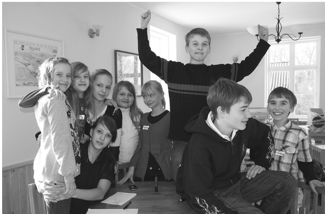
Pühajõe lapsed on olnud julged kaasamõtled ja oma ideede väljaütled mitmetes lastevanemate ning külaelanike ühistes ettevõtmistes.

Segu rõõmsameelsusest, innukusest ja koosolemise ergastava mõju tundmisest igal projektilaagri päeval annab Pühajõe küla lastele tuleviku tarbeks väärtuslikud oskused ja kogemused.