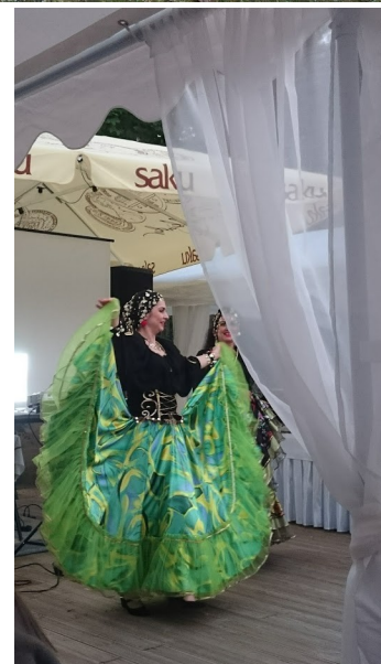
Foto on juunikuus 30. sünnipäeva tähistanud kohvikust Lemmik

Seekord kinnitab projektide hindamistulemused liikmete üldkoosolek.