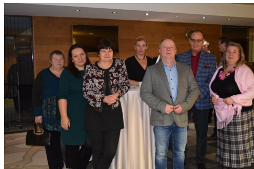
Fotod: üleval Narva-Jõesuu piirkonna liikmete esindajad; all ettevõtjate seminaril