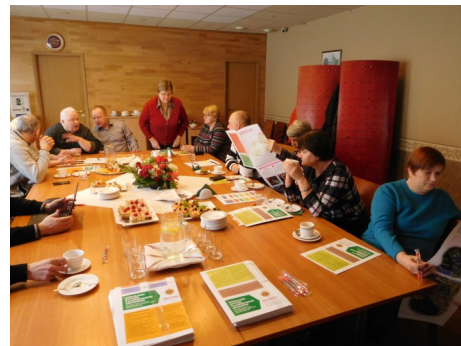
Fotol: päästeameti loeng

25. veebruaril juhatuse koosolek Jõhvis.